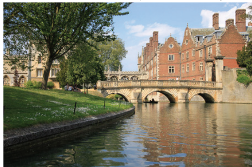
Wren Bridge (St. John's College)