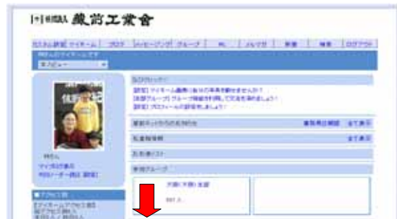
ブログを開設する ブログ未開設の方のみ

初めに ブログID(ユーザID)を登録する。(後から変更できない) www.kuramae.ne.jp/weblog/ (ユーザID) というURLのブログになる