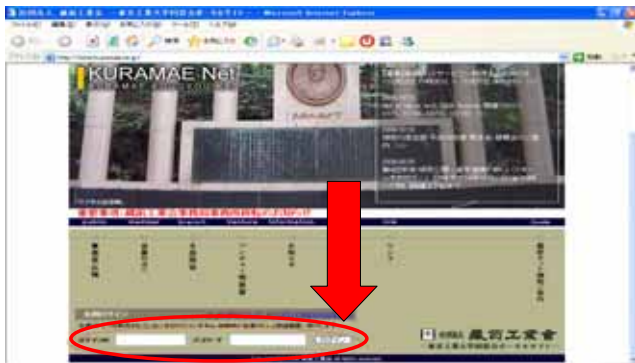
2006年3月に郵送された葉書のID、パスワードを入力し「ログイン」をクリック