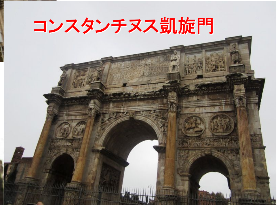
コンスタンチヌス凱旋門