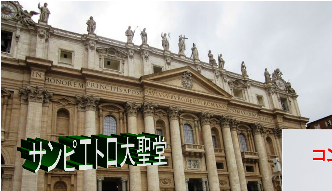
サンピエトロ大聖堂