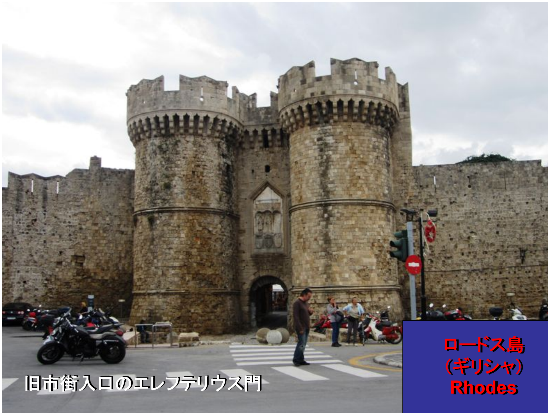
旧市街入口のエレフテリウス門